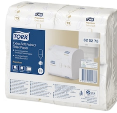
Tork Folded Toilet Paper Prem 2p 252s C&C 620275