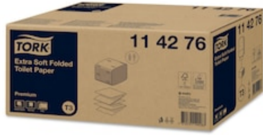
Tork extra weiches Einzelblatt Toipa T3 114276