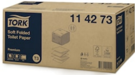
Tork weiches Einzelblatt Toipa T3 114273